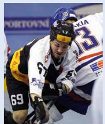
Titelbild: Vom 19. bis 28. Juni 2015 kämpfen die besten Nationalmannschaften im Streethockey in der BOSSARD Arena in Zug um den Weltmeistertitel.